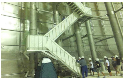
165段の階段を登ります。

9月5日(水)、市内のトップバッターとして、環小学校6年生が東京電力LNG地下式貯槽タンクに行ってきました。この落書き会は20年前にも開催されており、今回のタンク建設が富津火力発電所では最後になるとのことでした。