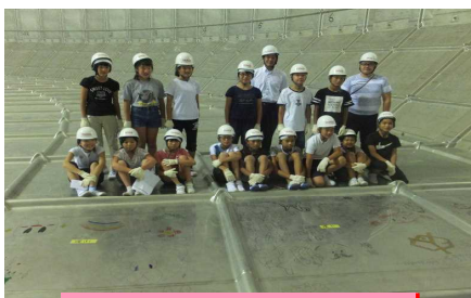
落書き完成：タンクにて