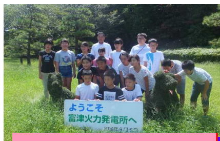
富津火力発電所に来ました。