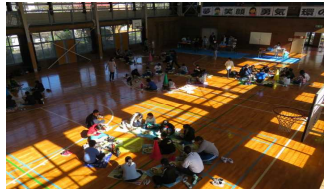
合同給食<環小体育館>

2020年度に天羽中学校と天羽東中学校が統合され、新生「天羽中学校」としてスタートします。現在の小学校5年生が天羽中学校に入学する際には、5つの小学校が共同の学校生活となります。