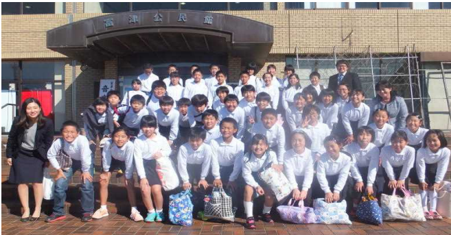
富津市音楽の集い<富津公民館>

君津地方音楽会では、16校の小学校が出場しました。(富津市からは3校出場)他市の大規模校では、有志(合唱部)による発表も多くあり、50名~70名で参加している中、環小は、5・6年生31名と少ない人数ではありましたが、一人一人が丁寧に心を込めて歌い上げ、今までの中で最高の歌声を君津市民文化ホールいっぱいに、きれいなハーモニーを響かせました。大舞台での合唱は緊張したと思いますが、貴重な経験を積むことができました。