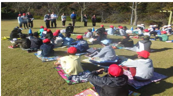
始めの会<市民の森>