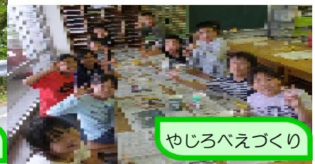
やしるべえづくり